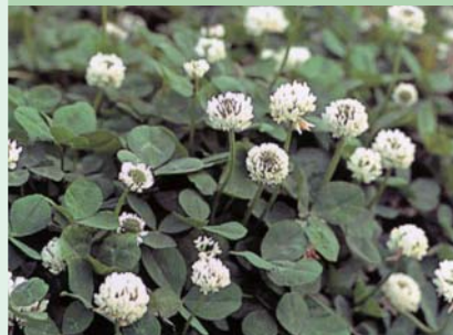
ホワイトクローバー