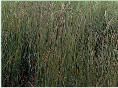
クリーピングレッドフェスク

寒地型 草丈 40 ~ 60cm 強健で耐乾性・耐暑性に優 れ、寒冷地でも生育する。