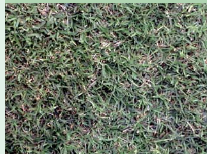
バミューダグラス (トランスコンチネンタル)

暖地型 草丈 10 ~ 15cm 耐踏圧性が高く、耐寒性も ある。ドワーフタイプ。