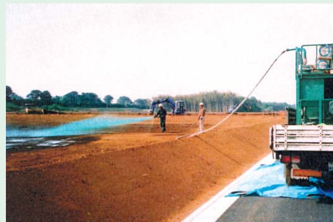
飛砂防止剤撒布工

( ) 内は以下の条件で 3ℓ/㎡ を 2回に分けて撒布（噴霧ノズル）する場合。 ①シルト系土質等、細粒分が多く浸透性の悪い土質の場合。 ②勾配が急で撒布液が流出する場合。 ③吸水性がよすぎて固結層が薄すぎる場合。