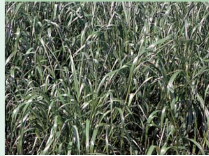
ペレニアルライグラス

寒地型 草丈 40 ~ 60cm 強健で耐乾性・耐暑性に優 れ、寒冷地でも生育する。