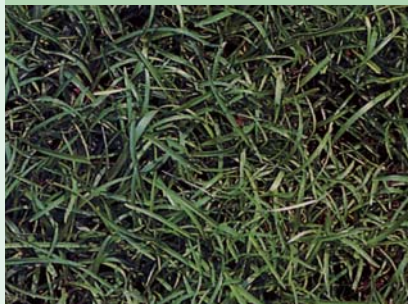
センチピートグラス

暖地型 草丈 10 ~ 20cm 発芽・初期生育はやや遅い。 雑草抑制効果がある。